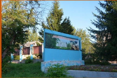
Городской информационный стенд имеет значительный износ