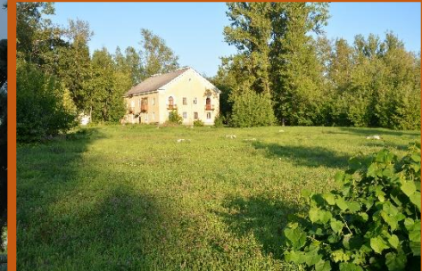
За информационным стендом – пустырь