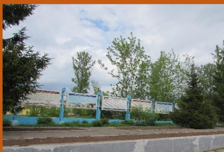
Зеленые насаждения вокруг стенда вырождаются и заражены болезнями