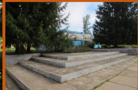
Железобетонные ступени и пешеходные дорожки изношены

СКВЕР на пересечении Социалистической и Школьной улиц