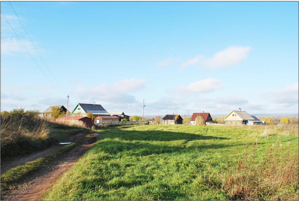
Фото д.Сара. 2009г., октябрь.