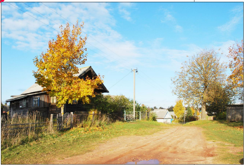
Фото д.Карповская. 2009г., октябрь.