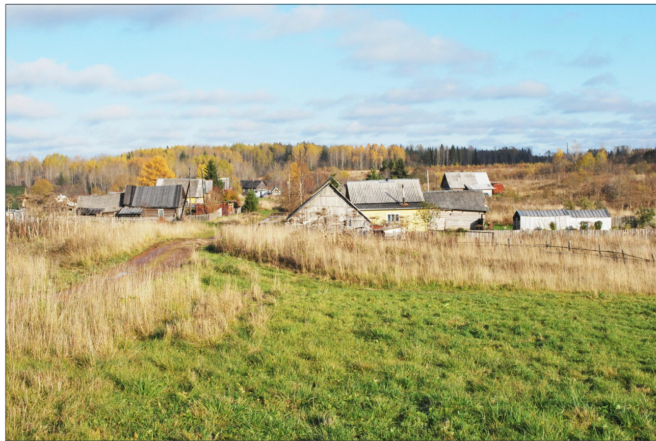
Фото д.Угол. 2009г., октябрь.