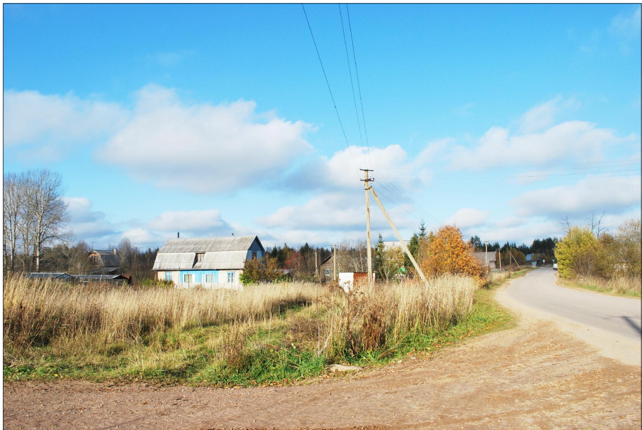
Фото д.Сычово. 2009г., октябрь.