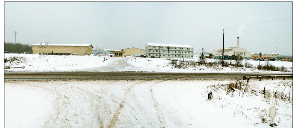
Деревообрабатывающее предприятие в районе д.Чудцы. 2009г., октябрь.