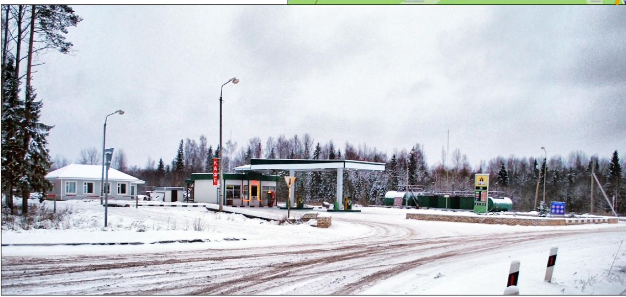
АЗС на федеральной автодороге Новая Ладога-Вологда. 2009г., октябрь.