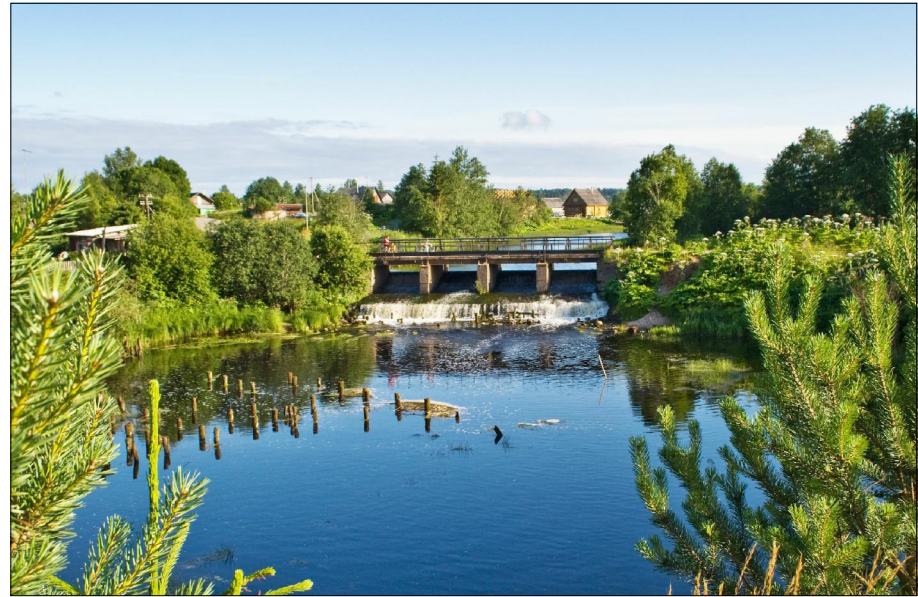
Фото р.Тихвинка в д.Окулово. 2009г., октябрь.