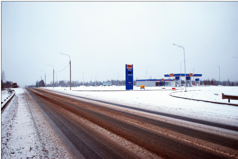
АЗС на федеральной автодороге Новая Ладога-Вологда. 2009г., октябрь.