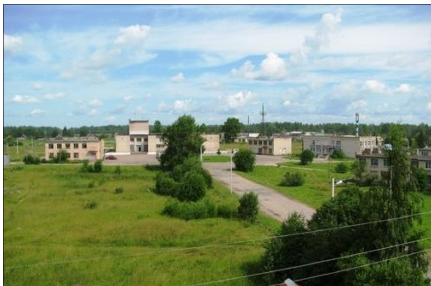
Фото пос.Совхозный, административный центр. 2009г., октябрь.