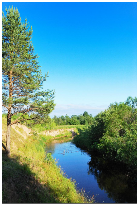
Фото р.Тихвинка в д.Окулово. 2009г., октябрь.