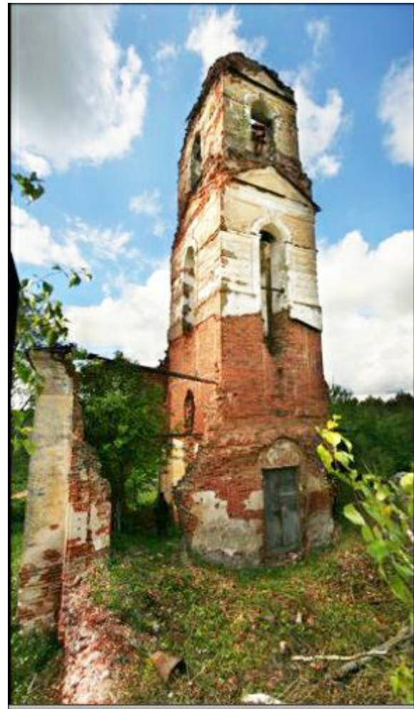
Фото Церковь в д.Окулово. 2009г., октябрь.